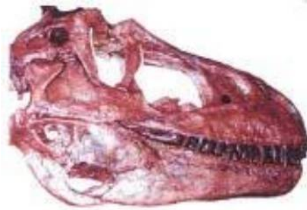
アルバートサウルス頭骨 Albertosaurus libratus 白亜紀後期／カナダ