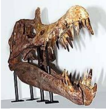
スコミムス頭骨 Suchomimus sp. 白亜紀前期／モロッコ