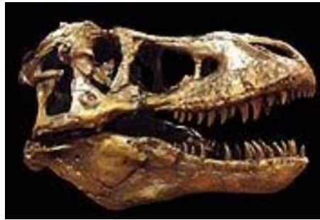
ティラノサウルス頭骨 T-rex(MOR555) 白亜紀後期／カナダ