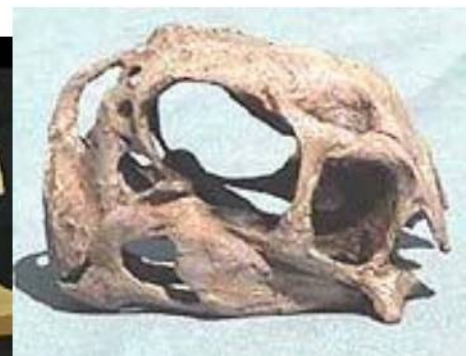
インゲニア頭骨 Ingenia yanshini 白亜紀／モンゴル