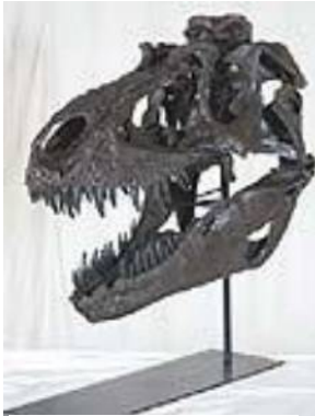
ゴルゴサウルス頭骨 Gorgosaurus sp. 白亜紀／モンタナ州