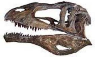
カルカロドントサウルス科