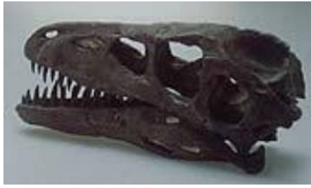
ドロマエオサウルス頭骨 Dromaeosaurus sp.