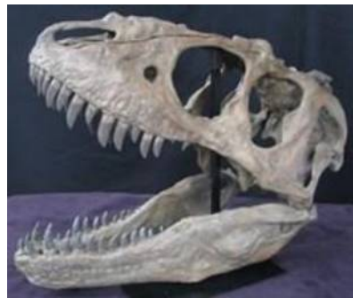
テラトフォネウス頭骨(76.2cm) Teratophoneus curriei 白亜紀／ユタ州