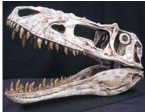
アリオラムス頭骨 Alioramus sp. 白亜紀／モンゴル