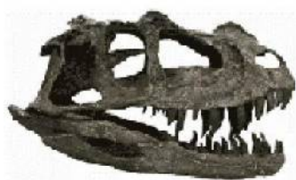
ケラトサウルス科