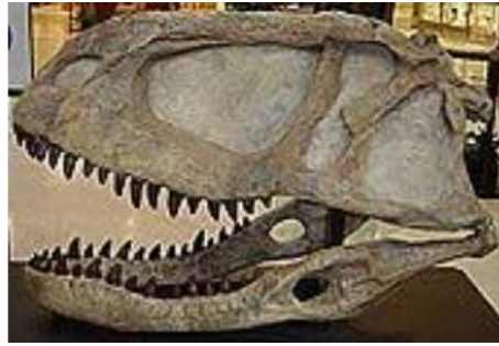
アベリサウルス頭骨 Abelisaurus comahuensis 白亜紀／アルゼンチン