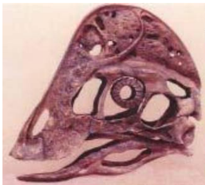
オビラプトル頭骨 Oviraptor philoceratops 白亜紀後期／モンゴル