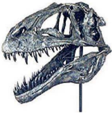
アクロカントサウルス頭骨 Acrocanthosaurus atokensis