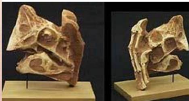
オビラプトル頭骨+手 Oviraptor mongoliensis 白亜紀後期／モンゴル