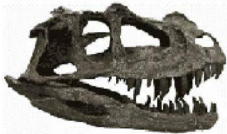
ケラトサウルス頭骨 Ceratosaurus ジュラ紀／ワイオミング州