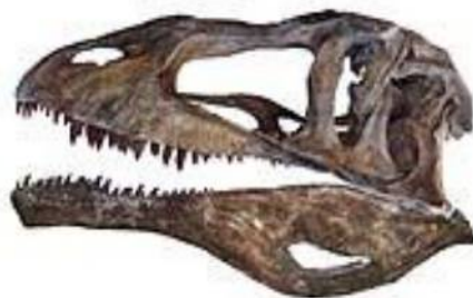
カルカロドントサウルス頭骨