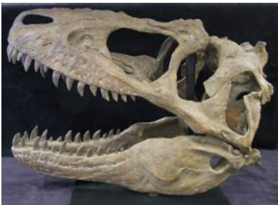
テラトフォネウス頭骨(63.5cm) Teratophoneus curriei 白亜紀／ユタ州