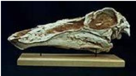
ガリミムス頭骨 Gallimimus bullatus 白亜紀／モンゴル