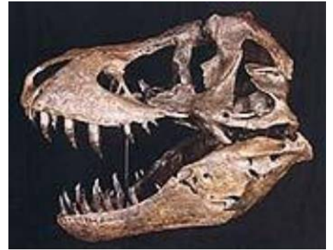
ティラノサウルス頭骨 T-rex(STAN) 白亜紀後期／アメリカ