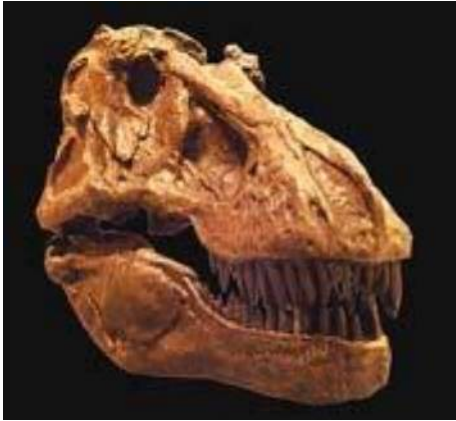
ティラノサウルス頭骨 T-rex(AMNH5027) 白亜紀後期／アメリカ