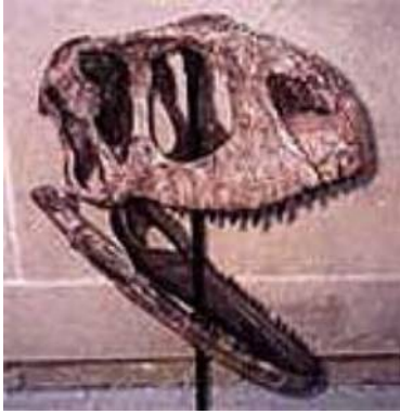
ルゴプス頭骨 Rugops 白亜紀／ニジェール