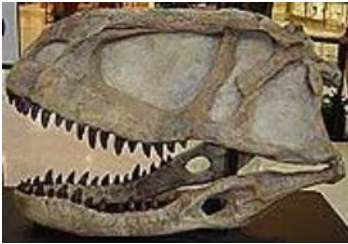
アベリサウルス科