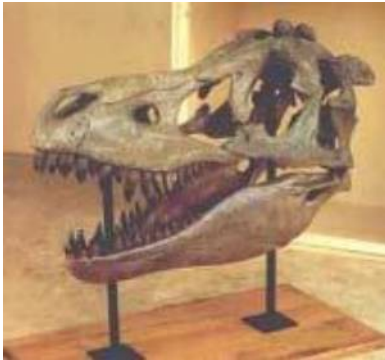
タルボサウルス頭骨 Tarbosaurus bataar 白亜紀後期／モンゴル