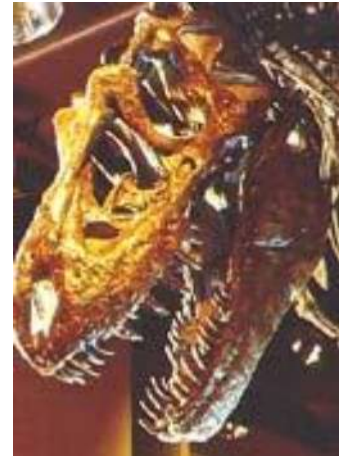
ダスプレトサウルス頭骨 Daspletosaurus torosus