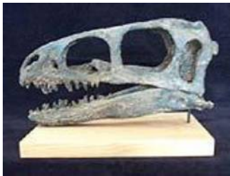
コエルロサウルス科