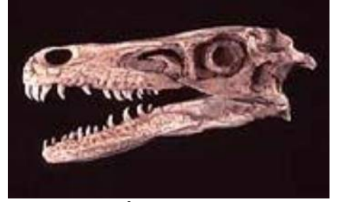
ベロキラプトル頭骨 Velociraptor mongoliensis 白亜紀／モンゴル