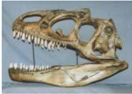
アロサウルス頭骨(生態) Allosaurus fragilis