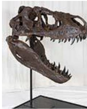
ティラノサウルス頭骨 T-rex(Bucky) 白亜紀／サウスダコタ州