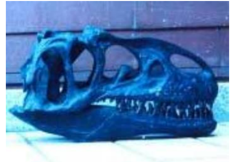
アロサウルス頭骨(亜生態) Allosaurus fragilis