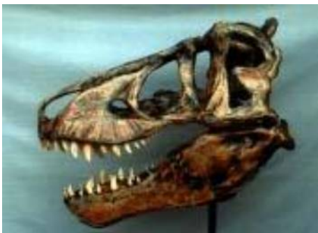
ティラノサウルス頭骨 T-rex(Harley) 白亜紀／モンタナ州