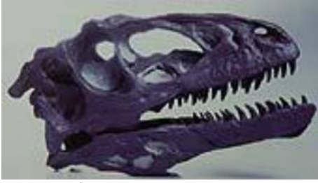
デイノニクス頭骨 Deinonychus sp. 白亜紀／モンタナ