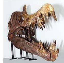
スピノサウルス科