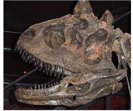
カルノタウルス頭骨 Carnotaurus sastrei 白亜紀後期／アルゼンチン