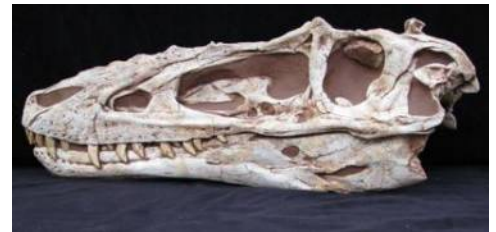
アリオラムス頭骨(産状) Alioramus alti 白亜紀／モンゴル