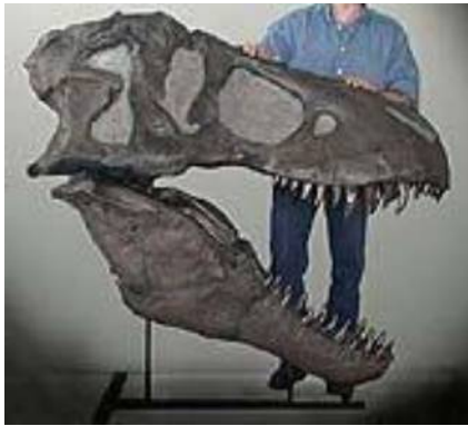
ティラノサウルス頭骨 Tyrannosaurus rex 白亜紀／モンタナ州