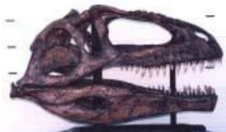
ギガノトサウルス頭骨