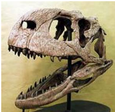
ラジャサウルス頭骨 Rajasaurus narmadensis 白亜紀／インド西部