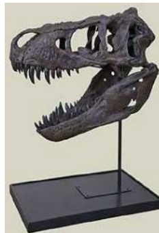
ティラノサウルス頭骨 T-rex(Duffy) 白亜紀後期／サウスダコタ州