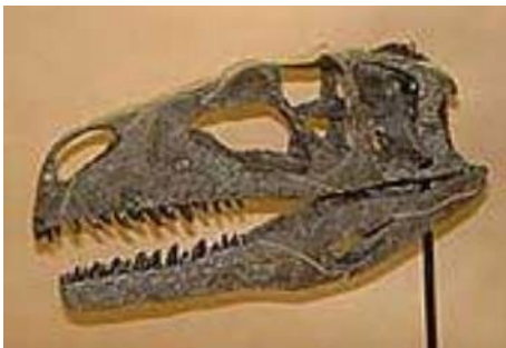
タニコラグレウス頭骨 Tanvcolagreus