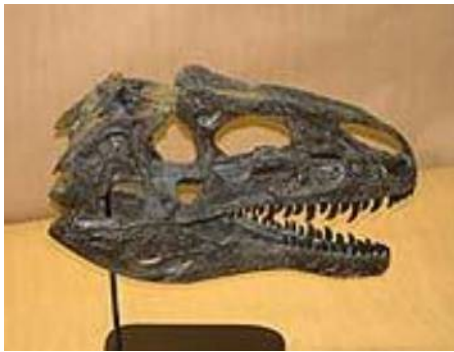
アロサウルス頭骨クリオロフォサウルス頭骨

Allosaurus jimmdadzeni Cryolophosaurus elioti