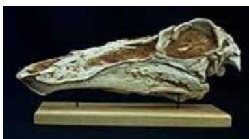
オルニトミムス科