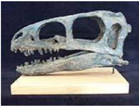
コエルロサウルス科頭骨 Zuni Coelurosaur 白亜紀／ニューメキシコ