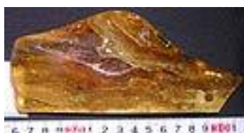
Hornets, Spider, Flies, Seed 中新世/南アメリカ