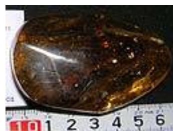
Fuzzy Caterpillar, Hornets, etc.,amber 中新世/南アメリカ