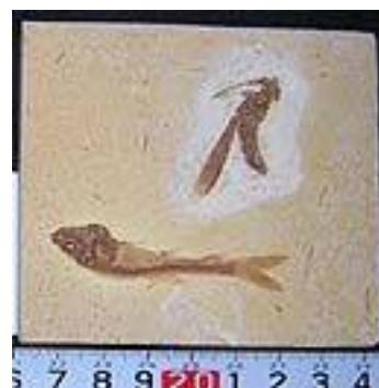
Tettigonioid with Fish 白亜紀/ブラジル