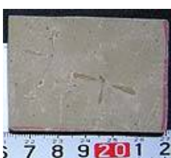
Cranefly 始新世/コロラド州