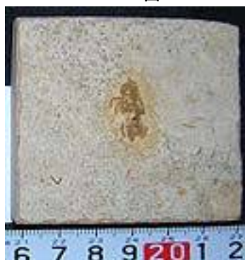
Psestocixius fuscus 白亜紀/ブラジル