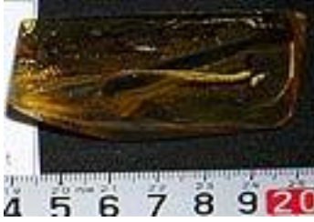
Dorylus, Fly, Bee, amber