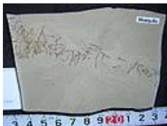
Mosquito 始新世/コロラド州