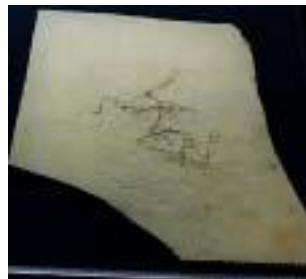
2048:始祖鳥(アイヒェル:ホジ) サイズ：38×35cm