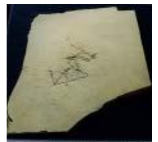
2047: (アイヒェル:ホジ) サイズ：48×32cm ジュラ紀後期/ドイツ