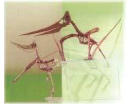
プテラノドン骨格：メス Pteranodon sternbergi 白亜紀後期／アメリカ サイズ：335cm