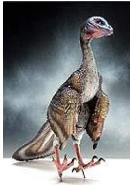
始祖鳥生態 Archaeopteryx サイズ：？cm ジュラ紀後期/ドイツ