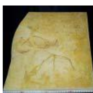
2027: (マックスベルグ:ホジ) サイズ：48×32cm ジュラ紀後期/ドイツ