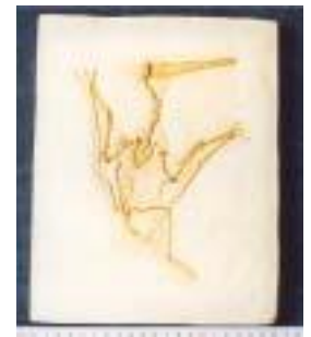
2018:プテロダクティルス ジュラ紀後期／ドイツ サイズ：26×20cm