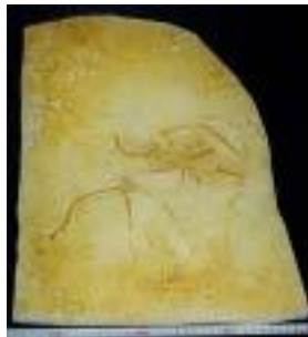
2028:始祖鳥(マックスベルグ:ホジ) サイズ：38×35cm