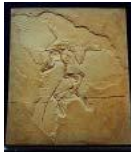
2019:始祖鳥(ベルン:ホジ) サイズ：49×40cm