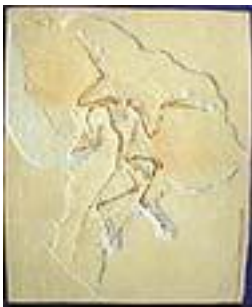
C193:始祖鳥(ベルン) サイズ：50×40cm ジュラ紀後期/ドイツ