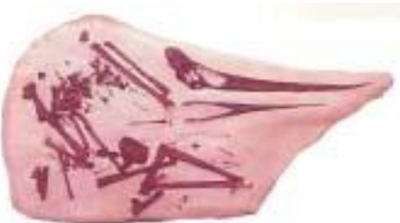
プテラノドン骨格 Pteranodon sternbergi 白亜紀後期／アメリカ サイズ：？cm