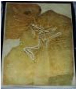
2024:始祖鳥(ロトン) サイズ：59×45cm ジュラ紀後期/ドイツ