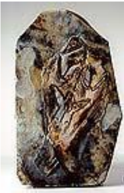
孔子鳥(No.5) サイズ : 30×20cm ジュラ紀後期/中国