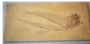
C175:ランフォルリカス ジュラ紀前期／ドイツ サイズ：63×31cm