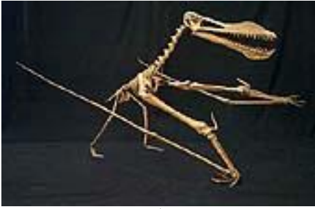
アンハンゲエラ骨格 Anhanguera blittersdorfi 白亜紀前期／ブラジル サイズ：390cm