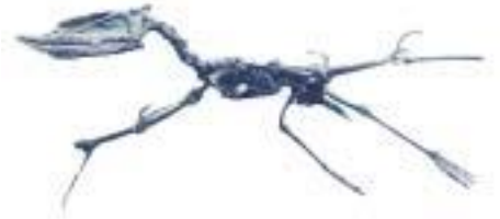
ズンガリプテルス骨格 Dsungaripterus weii 白亜紀後期／中国 サイズ：300cm