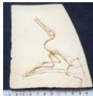
2045:プテロダクティルス サイズ：12×12cm ジュラ紀後期／ドイツ