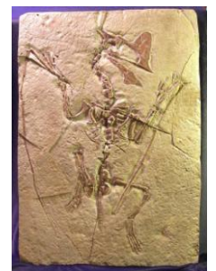
タペヤラ骨格 サイズ：81cm 白亜紀／ブラジル