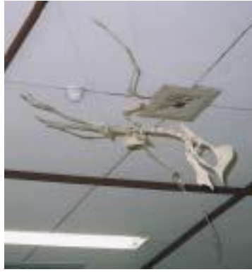
タペヤラ骨格 Tapejara wellnhoferi 白亜紀後期／ブラジル サイズ：120cm