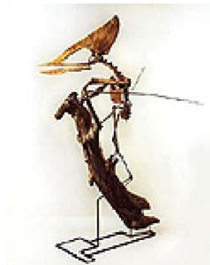
トゥプクスアラ骨格 Tupuxuara sp. 白亜紀／ブラジル サイズ：370cm