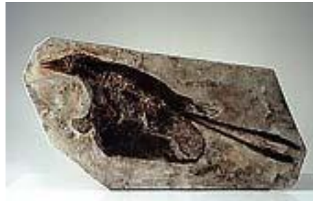
孔子鳥(雄 : No.8) サイズ : 60×30cm ジュラ紀後期/中国