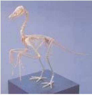
始祖鳥骨格 Archaeopteryx サイズ：43.2cm ジュラ紀後期/ドイツ