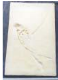
2020:ランフォルリカス ジュラ紀後期／ドイツ サイズ：61×38cm