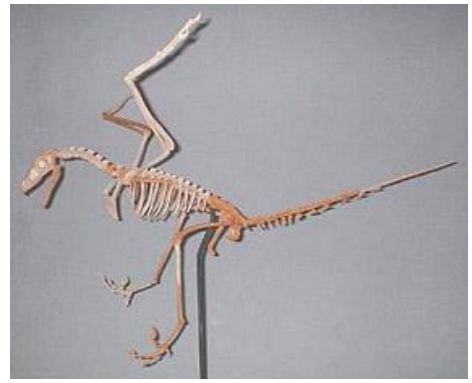
ラホナビス骨格 (始祖鳥科) Rahonavis ostromi サイズ：60cm 白亜紀後期/マダガスカル