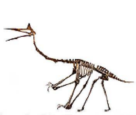
ケツアルコアトルス骨格 Quetzalcoatlus nortropi 白亜紀／アメリカ サイズ：12m