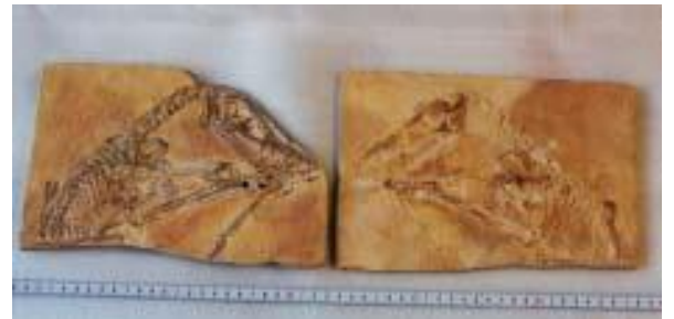
スカフォグナトス骨格 ジュラ紀前期／ドイツ サイズ：24×18cm(2枚)