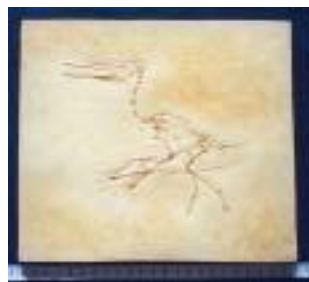
2040:プテロダクティルス サイズ：20×23cm ジュラ紀後期／ドイツ