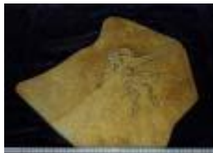
2030: (アイヒェル:ホジ) サイズ：36×38cm ジュラ紀後期/ドイツ