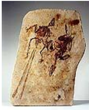
孔子鳥(雄+雌 : No.8) サイズ : 60×45cm ジュラ紀後期/中国