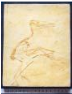
2022:プテロダクティルス サイズ：52×38cm ジュラ紀後期／ドイツ