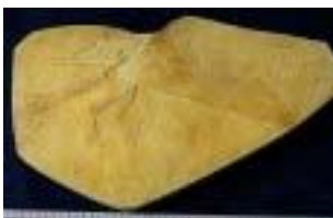
2029:始祖鳥(アイヒェル:ホジ) サイズ：25×47cm