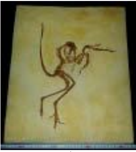
2049:始祖鳥(ゾルンフォフエン) サイズ : 52×38cm ジュラ紀後期/ドイツ