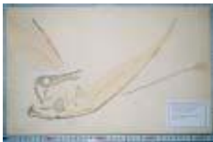
C174:ランフォルリカス ジュラ紀前期／ドイツ サイズ：41×26cm