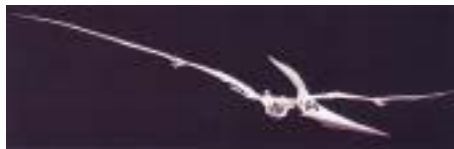
プテラノドン骨格：オス Pteranodon longiceps 白亜紀後期／アメリカ サイズ：732cm