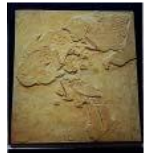
2026:始祖鳥(ベルン:ホジ) サイズ：46×39cm ジュラ紀後期/ドイツ