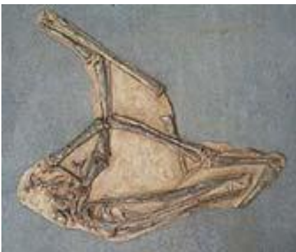
サンタナダクティルス骨格 Santanadactylus pricei 白亜紀前期／ブラジル サイズ：109cm