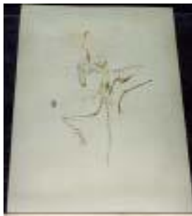
C194:始祖鳥(ロトン) サイズ：61×43cm ジュラ紀後期/ドイツ