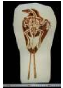
孔子鳥 サイズ : 48×24cm 白亜紀後期/中国