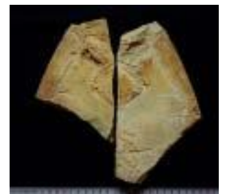
2031AB:始祖鳥(テイラー) サイズ：2枚セット ジュラ紀後期/ドイツ